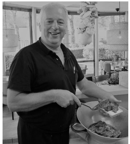
Arnold met overheerlijke kibbeling