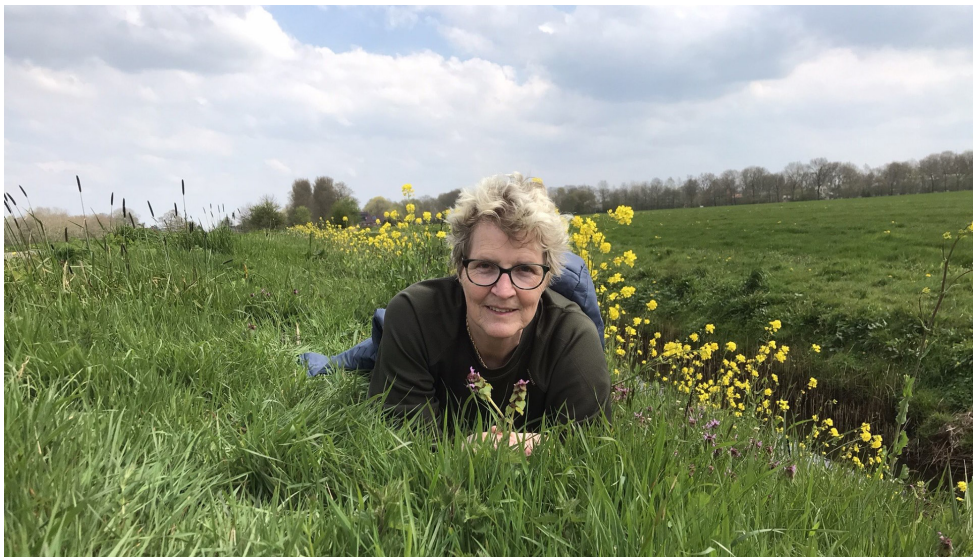
'nieuwe soort veldmuis ontdekt'